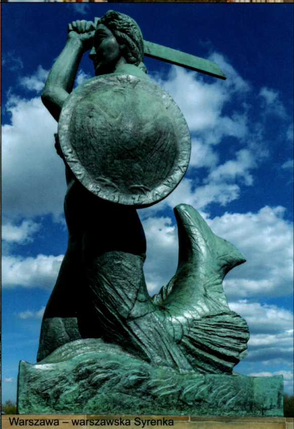
Warszawa – warszawska Syrenka

PODRÓŻ PO POLSCE – „Zwiedzamy naszą ojczyznę” – ilustracja 1 z 2