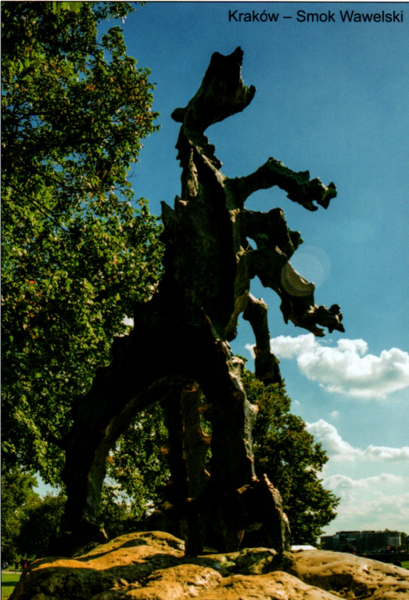
Kraków – Smok Wawelski