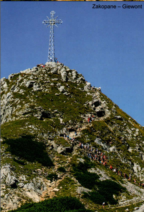
Zakopane – Giewont