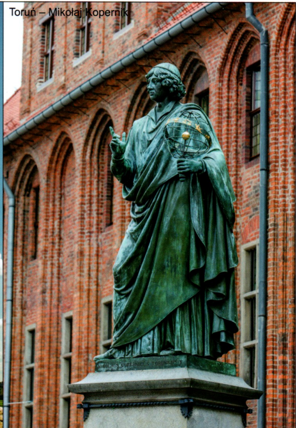
Toruń – Mikołaj Kopernik