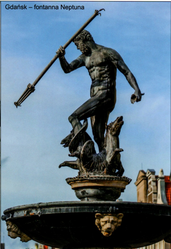
Gdańsk – fontanna Neptuna