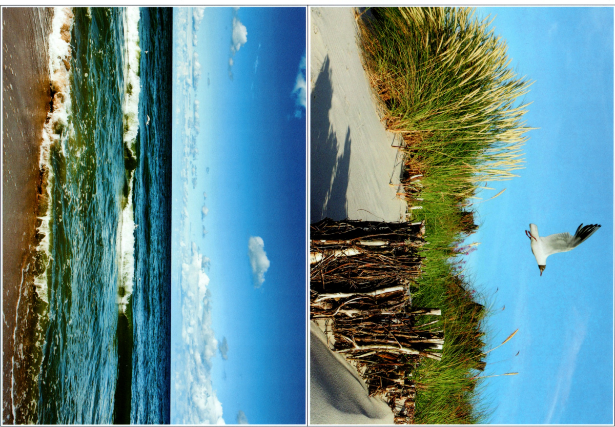
Planoc dydaktyczna stanowi integralną część scenariusza zajęć z numeru 10 229 października 2020 miesięcznika BILEJ PRZESZKOLA – materiały na listopad. Funkcje i zdjęcia chronione są prawami autorskimi – kopowanie, odforsowanie, dystrybucja w internecie lub wykorzystywanie w innych celach niż przewidziane jest niedozwolone.