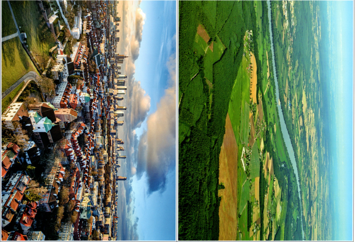
PODRÓŻ PO POLSCE – „Podróż po Polsce” – ilustracja 1 z 6

Formoc dydaktyczna stanowi integralną część scenariusza zajęć z numeru 10 229 października 2020 miesięcznika BLZEJ PRZEDSKOŁA – materiały na listopad. Fysunki i zdjęcia chronione są prawami autorskimi – kopiowanie, odesprzedaż, dystrybucja w internecie lub wykorzystywanie w innych celach niż przewidziano jest niedozwolone.