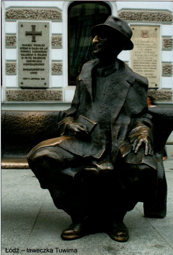
Łódź – ławeczka Tuwima

Pomoc dydaktyczna stanowi integralną część scenariusza zajęć z numeru 10.229 październik 2020 miesięcznika BLUZEJ PRZEDSKOŁA – materiały na listopad. Rysunki i zdjęcia chronione są prawami autorskimi – kopiowanie, odsprzedaż, dystrybucja w internecie lub wykorzystywanie w innych celach niż przeznaczono jest niedozwolone.