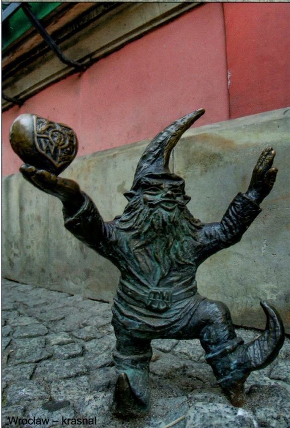
Wrocław – krasnal