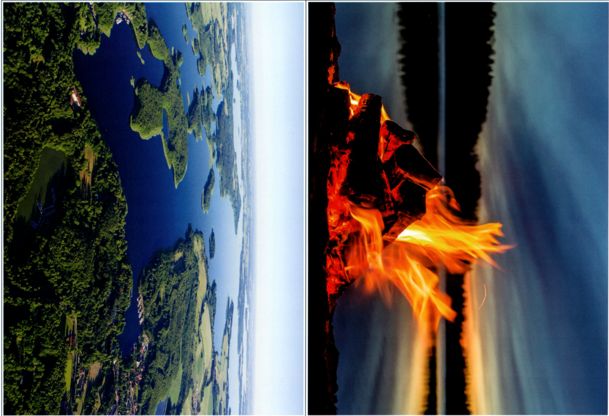
Planoc dydaktyczna stanowi integralną część scenariusza zajęć z numeru 10 229 października 2020 miesięcznika BILEJ PRZESZKOLA – materiały na listopad. Funkcje i zdjęcia chronione są prawami autorskimi – kopowanie, odforsowanie, dystrybucja w internecie lub wykorzystywanie w innych celach niż przewidziane jest niedozwolone.