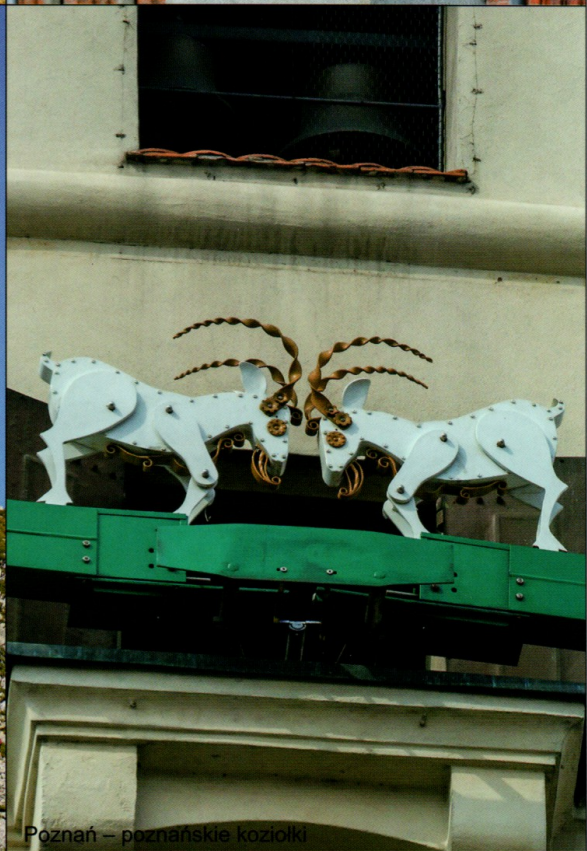
Poznań – poznańskie koziołki

Pomoc dydaktyczna stanowi integralną część scenariusza zajęć z numeru 10 229 października 2020 miesięcznika BLIŻEJ PRZEDSZKOLA – materiały na listopad. Rysunki i zdjęcia chronione są prawami autorskimi – kopiowanie, odsprzedaż, dystrybucja w internecie lub wykorzystywanie w innych celach niż przeznaczonych jest niedozwolone.